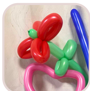
①ハムちゃんと バルーンアート