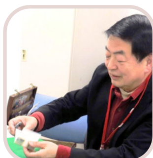
⑦マジックを やってみよう