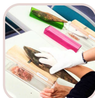
④かつお節けずり 体験講座