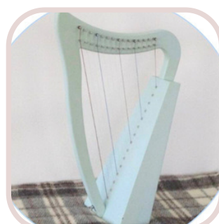
⑨ハープできらきら 星を弾こう