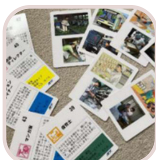
⑥おしごとカードで 職業探検隊