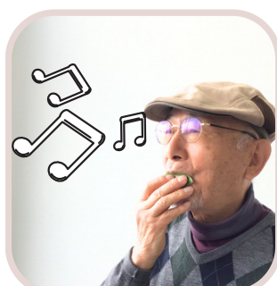
⑩草笛を 吹いてみよう