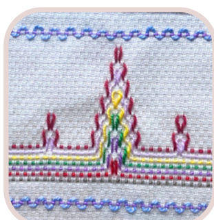
②クリスマスの スエーデン刺繍