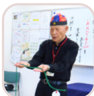
③手品をマスター して友達を作ろう