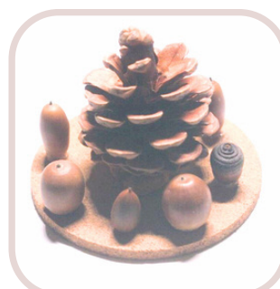
⑧自然物を使って おもちゃ作り