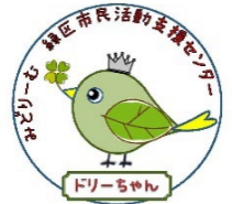
みどリーむ運営委員会 キャラクター