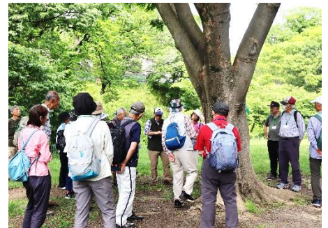
令和6年度 自然を楽しむ講座 区内公園にて

みどリーむ運営委員会では、地域の皆さんが歴史や文化、生活などの学びをとおして、地域への愛着を深めていただけるような生涯学級講座を企画しています。詳しくは、みどリーむホームページをご覧ください。