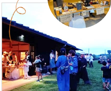
夏至トワイライトガーデン (にいほる里山交流センター)

これからも様々なつながりを大切にし、つながった人が輝ける場所を提供するような「新たな企画」を立てたいと思っています。人とのつながりや、「ありがとう」と言われる経験からは、最高の充実感と癒しを得られます。興味のある方、是非ご参加ください。