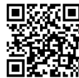
みどリーむホームページ

※令和7年度予算の執行を伴う事業などは、市会での議決後に確定します。 - 4 -