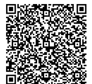
横浜線ものがたり 電子申請申込先