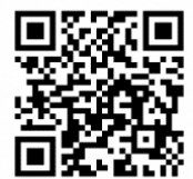
みどリーむホームページ