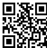
野良の暮らし ホームページ二次元コード