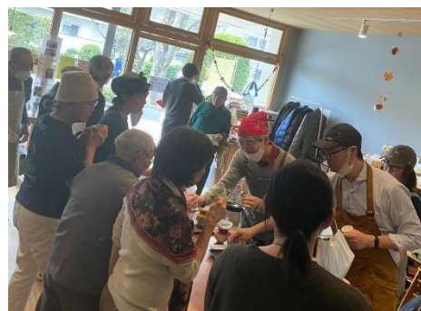
珈琲試飲イベント (ぶらっと kiricafe)

@NAGATUSDA_COFFEE_DRIP 長津田みなみ台珈琲淹れ方研究会 Instagram 二次元コード