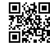
にいほる里山交流センター ホームページ二次元コード