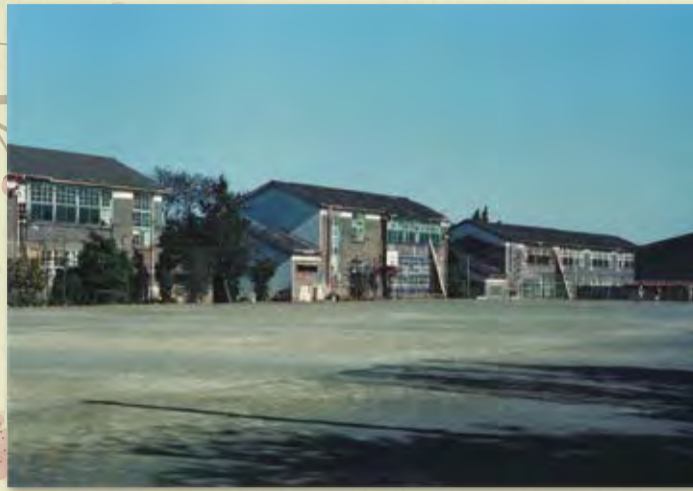
おぎのみのる(昭和55年)