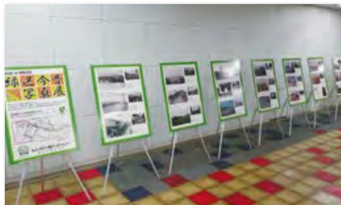
▲地下鉄グリーンライン中山駅 イベントスペースでの写真展