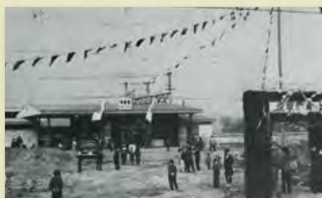
提供者: 柳下 勤(昭和37年)