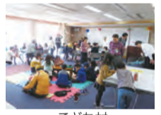
こども村 オープニングイベント