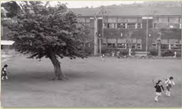
撮影者: 千原 康夫(昭和59年)