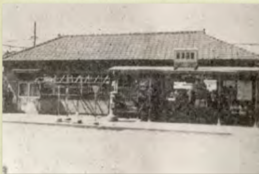
(昭和初期)