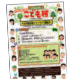
こども村ポスター

昨年12月には「こどもの居場所「こども村」」を立ち上げ、地域ケアプラザを会場に月2回開催しています。