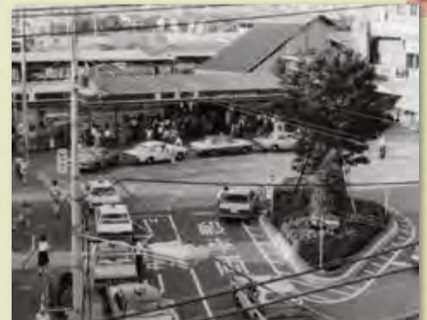
撮影者: 不明、緑区役所蔵(昭和58年)

鴨居駅は地元住民が寄付をつのり開業した請願駅です。3代目に当たる現在の鴨居駅は平成10年に改修されました。