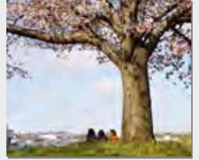
「春の日女子トーク」