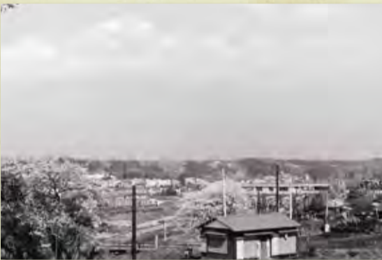
おぎの とみぞう(昭和40年頃)