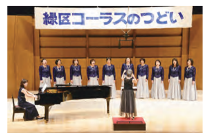
▲緑区コーラスのつどい

緑区内のコーラスグループが協力して運営する手づくりの合同演奏会です。 演奏会 ☎11月10日(日) 園みどりアートパーク 委員会 ☎1月1回程度 ※各団体から代表者が出席。第1回は6月11日(火)10時から 園緑公会堂 園緑区内で活動するコーラスグループ 園参加・出演料:1団体3,000円および出演者1人につき100円(予定)。 別途「緑区コーラスの会」年会費:1団体1,000円 4月11日~5月31日消印有効で、申込書を記入し 園みどり一む No.22(〒226-0011 中山町93-1)へ ※詳細は募集チラシ参照。チラシ・申込書は緑区役所、みどり一む、緑区内各地区センターで配布。緑区からもダウンロード可