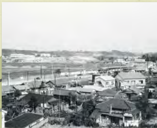
撮影者: 扇谷 克幸(昭和41年)