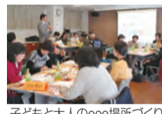
子どもと大人のeee場所づくり (everyday enjoy egao)

地域で学習支援や食支援を行うグループと地域の皆さんが意見交換を行う「子どもと大人のeee場所づくり」を開催しました。今後は共通ののぼり旗などを作成し、連携やPR活動を進めていく予定です。