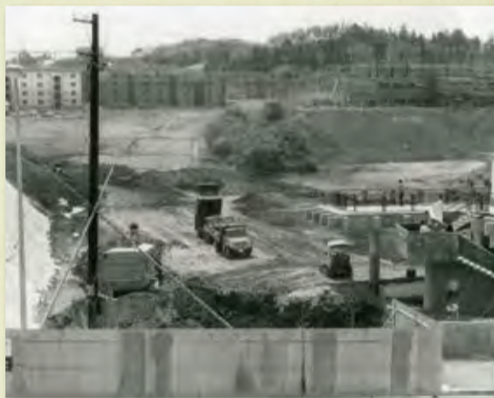
(昭和47年頃)