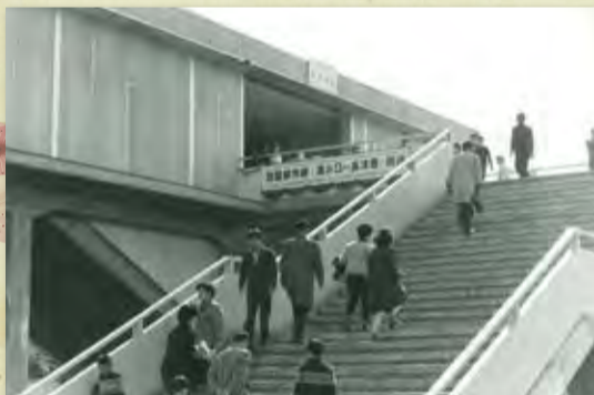
撮影者: 不明、東急長津田駅蔵(昭和41年)