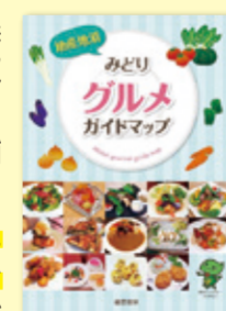
地産地消みどり グルメガイドマップ

緑区には、横浜市内産の農産物を積極的にメニューに取り入れている飲食店「よこはま地産地消サポート店」が18店舗あります。※令和2年7月10日現在 緑区産の農産物を使ったお薦めメニューや営業情報を地産地消みどりグルメガイドマップで紹介しています。詳しくは目で確認してください。