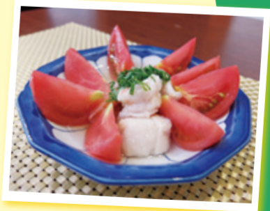
▲トマト冷やし煮びたしと魚介

緑区の農業や旬の農産物、直売所情報、よこはま地産地消サポート店が考案した緑区産の農産物を使ったレシピ動画などを発信しています。