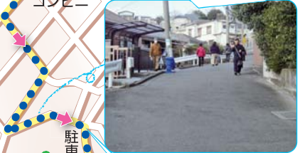
右に曲がると、 道が細くなります