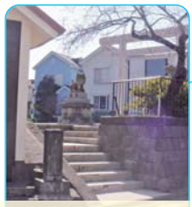
白幡神社 (永田南二丁目9-26)