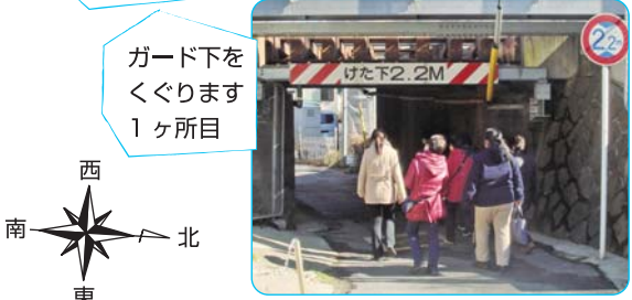
ガード下を くぐります 1ヶ所目