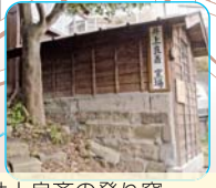
井上良斎の登り窯 (永田東一丁目31-12)