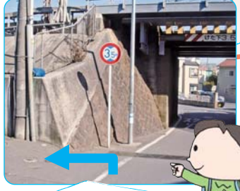
ガード下の手前を 左に曲がります