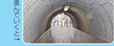
清水ヶ丘公園側 出入口