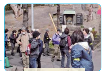
伝長者墓とタブの木 (永田南二丁目1-3)