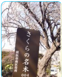
南区指定のさくらの名木と 久良岐郡の旧地名表示