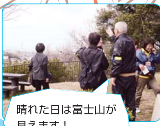
晴れた日は富士山が 見えます!