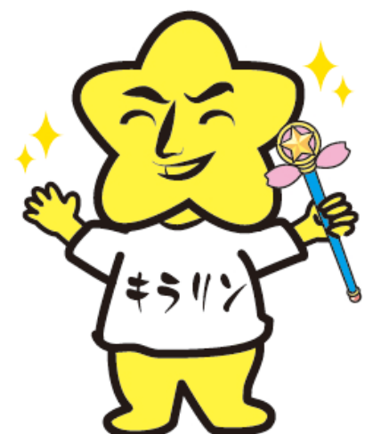
地域のカ応援部長「キラリン」