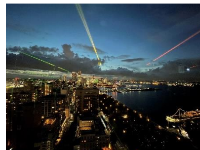
2023年度 中高生部門金賞 《光の中心》