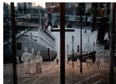
2023年度 一般部門金賞 《開港の道》