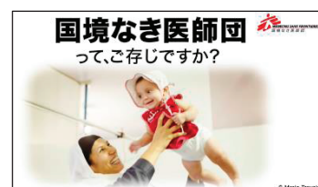
国境なき医師団のPR動画のナレーションを担当