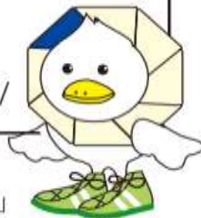
なか区民活動センターマスコット「もなか」

なか区民活動センター ホームページ http://www.city.yokohama.lg.jp/naka/ncac/