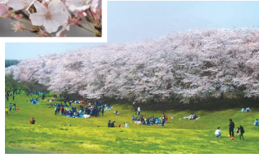
▲根岸森林公园（根岸森林公园）