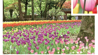
▼横滨公园（横滨公园）