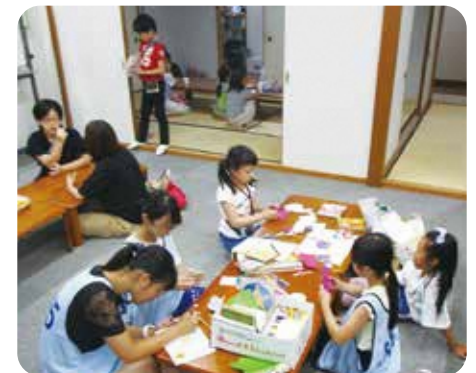
子どもの居場所「ふりーサロン5」の様子