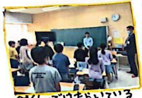
くまぐまごはたらいでいるくまぐまごさんにくまぐまごごんがくまぐまごをくまぐまごしました。

※各マンション非常用の発電機が動かないのは約6時間です。その後には電気が使えません