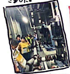
ブラリアグランドへ見学しました。4-1 もっとあんきも大きくなる！