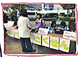
高木のパークにて、町の人に活動の発表の場を設けました。