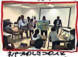
ネパールの子供のイラストがみんなのこころをう