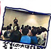
おもしろいお話を見ました。