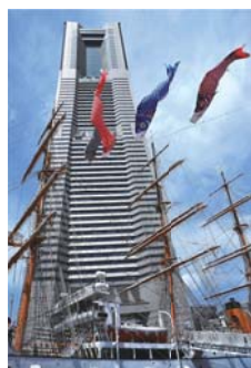
▲西区フォトコンテスト 応募作品

■帆船日本丸・横浜みなと博物館(みなとみらい2-1-1) 連休中は、船の折り紙教室、演奏会、フリーマーケットと盛りだくさん。5月5日(日)まで大きな鯉のぼりが泳ぎます。芝生広場でのんびり過ごすのもおすすめです。