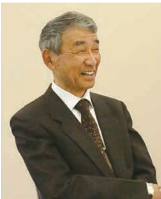
「退職後は社会とのつながりが薄れがちですが、委員をやることでつながりを実感しています。」

仕事をしていた時は、地域活動にはほとんど関わりませんでした。自分の子どもはさまざまな地域の行事に参加し、お世話になったので、退職してから恩返しのつもりで委員を引き受けました。「困りごとは何でも電話してください」と話しています。日常生活のささいなことでも相談が寄せられるようになり、少しはお役に立てているのかなと思えるようになりました。