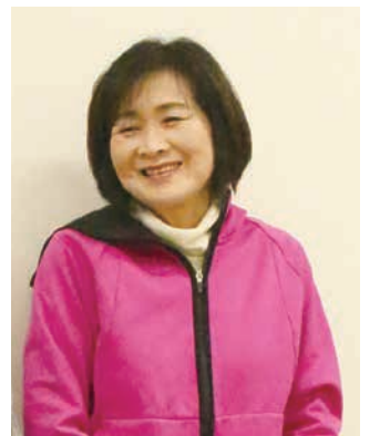
「いつまでもかわいい子どもたちと関わることが喜びです。仲間とやり遂げる達成感があります。」