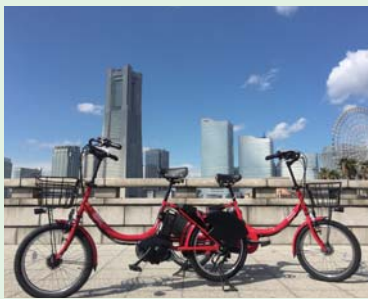
赤い自転車が目印です