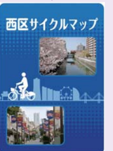
折り畳み時はポケットサイズで持ち運びに便利です

配布場所 区役所(4階47番窓口・1階1番窓口)、西地区センター、藤棚地区センター ほか