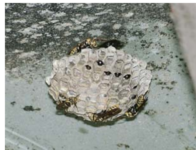
アシナガバチの巣 (直径15cm程度 はすの実型)