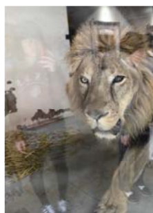
▲西区フォトコンテスト 応募作品

■帆船日本丸・横浜みなと博物館(みなとみらい2-1-1) 連休中は、船の折り紙教室、演奏会、フリーマーケットと盛りだくさん。5月5日(日)まで大きな鯉のぼりが泳ぎます。芝生広場でのんびり過ごすのもおすすめです。