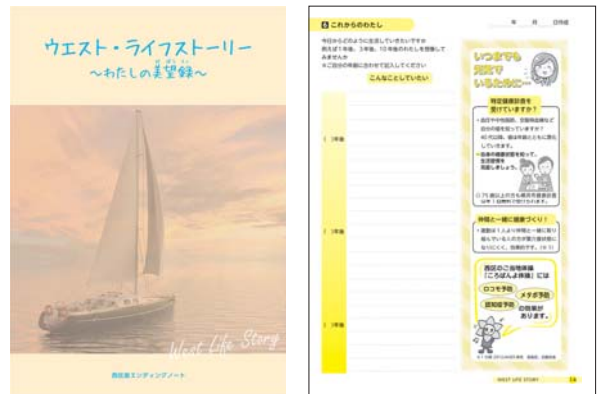
人生を振り返り、ノートに気持ちを記入していきます