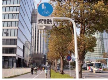
自転車及び歩行者専用

歩道を通行できるのは、①道路標識で指定されたところ、②13歳未満の子ども・70歳以上の高齢者・体が不自由な人などに限られます。車道は右側通行禁止です。