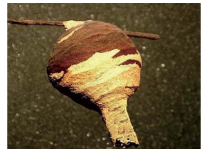
スズメバチの巣 (初期 とっくり型)