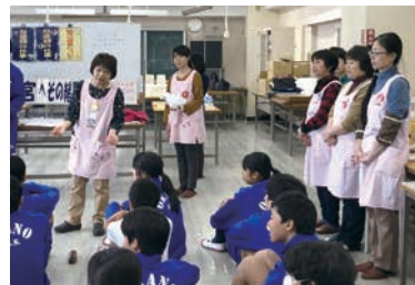
中学校で体験学習を手伝います

PTAの役員を終えた時に、声をかけられて委員を引き受けました。区役所が中学生を対象に行っている体験学習「いのちの教室」では、中学校で赤ちゃんの沐浴体験、妊婦体験を手伝っています。体験後、「もっとお母さんに感謝しよう」「やってくれてありがとう」など、生徒が気づきや感想を伝えてくれる小さな一言が何より嬉しいですね。