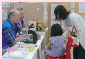
缶バッジは持参の写真(直径5cm)でも作れます