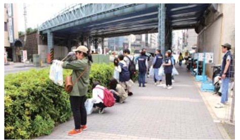
昨年は250人を超える人が清掃活動に参加しました