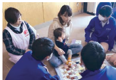
親子とふれあう体験を通して、学びが生まれます

「赤ちゃん教室」で小児救急を保護者に伝えるために心肺蘇生法を学び、普及員の資格を取りました。学校での会議や地域の行事に出ることもあります。子どもに関わり、学校と地域、家庭と行政などをつなぐ役割を約18年間務めました。解決に向けてのお手伝いを地域でできたことは、自分にとっても多くの学びがありました。