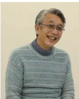
「委員になると地域とつながりが強くなります。地域の行事を手伝う機会も増えました。」

自治会長から話があって委員を頼まれました。民生委員・児童委員が何をやるのかも分からなかったのですが、「難しいことはありません」と言われ、引き受けました。やってみたらいろいろな仕事があるんですね。難しいと感じるのは、虐待や暴力のことなど個人情報にかかわる部分です。1人で抱え込まないように、仲間と協力しあってやっています。