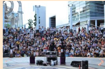
西区フォトコンテスト▶ 応募作品

■日産グローバル本社ギャラリー(高島1-1-1) 最新の車の展示・試乗のほか、休日にはさまざまなイベントを開催。カフェ、キッズスペースなど、ゆったりとした空間でクルマの魅力を体感できます。