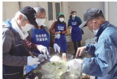
地域のお祭りでやしそばを作ることも