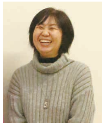
「一本松小学校の“感謝の会”で、子どもから感謝状をもらった時、やってよかったと思いました。」