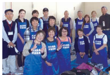
地域のバザー出店。仲間と協力して