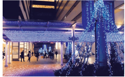
はまテラス(横浜駅東口)