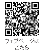
ウェブページはこちら

80周年お祝いメッセージや、記念事業の紹介、西区の主なイベント、平沼高校生のお気に入りスポットなど、どんな世代の人にも楽しんでもらえる記念誌を編集しました。