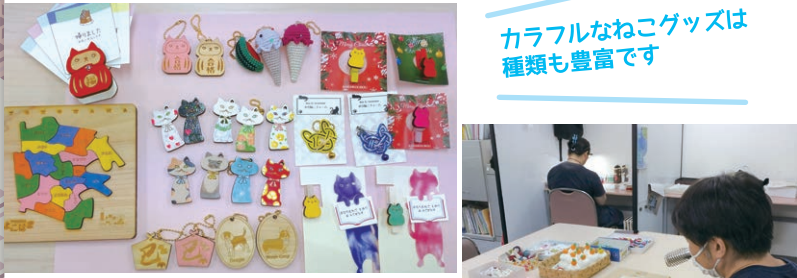
カラフルなねこグッズは種類も豊富です

西横浜駅から徒歩5分の場所にあり、木工製品やあみぐるみ、水引きなどで、カラフルなねこグッズや季節の製品を作っています。製品は近くの「カフェさらい」でも販売していますので、ぜひお買い求めください。