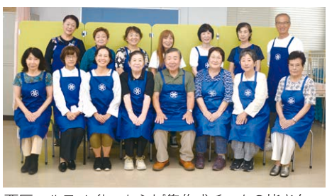
西区ヘルスマイト レシピ集作成チームの皆さん