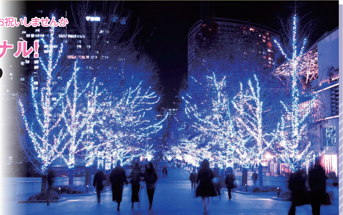
幻想的な雰囲気が漂うグランモール公園

昨年度からさまざまに行ってきた区制80周年記念の取組が、ついにファイナルを迎えます。西区キャンドルアートとの特別コラボレーションイベントなど、区内のいろいろな場所で記念の年をお祝いしています。街に出てみんなで楽しみましょう。