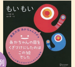
「もいもい」作:市原淳 出版社:ディスカヴァー・トゥエンティワン