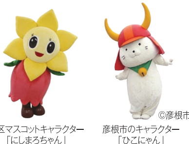
西区マスコットキャラクター 「にしまろちゃん」