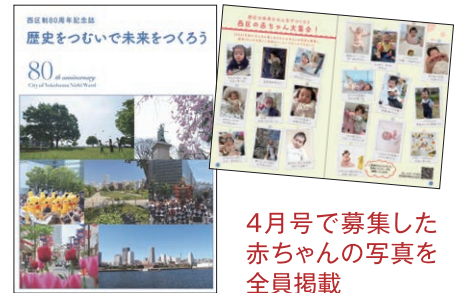
4月号で募集した赤ちゃんの写真を全員掲載

問合せ 西区制80周年記念事業実行委員会(区政推進課内) ☎320-8321 ☎314-8894