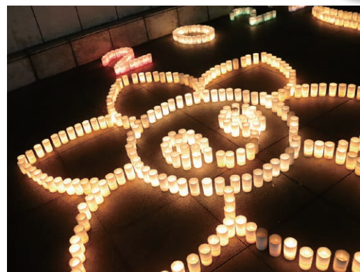
彦根市のキャラクター 「ひこにゃん」