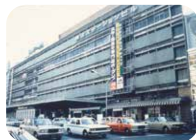
昭和57年頃の横浜駅西口

西区と西区民まつりの歴史を振り返るパネルを展示します! 「旧東海道すざろく」で遊べるブースと併せて、ぜひ西区と西区民まつりの歴史を感じてください!