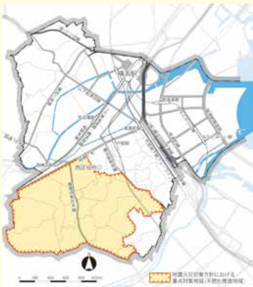
地震火災対策方針における重点対策地域(不燃化推進地域)地図

広報よこはま西区版9月号(平成27年9月)特集「地震発生時の火災から身を守ろう!」に掲載した地震火災対策方針における区内の重点対策地域(不燃化推進地域)について、対象となる地域のより詳細な地図が都市整備局ホームページの「不燃化推進地域」ページで見ることができます。