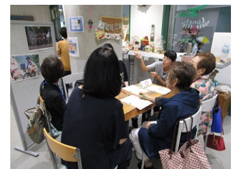
ヒューマンライブラリーの開催