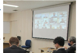
オンライン会議の実施