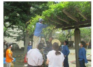
再生に向けた藤棚の剪定

・潤い空間づくりを進めるため、花苗の提供や協働での植え付けを行います。また、藤の花の再生に取り組み、地域の賑わい活性化を目指します。