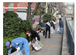
様々な主体との地域清掃活動

・東京 2020 オリンピック・パラリンピックに向けて、地域の皆さまや在勤者の方、学校・企業などと連携し、地域の清掃活動を強化します。