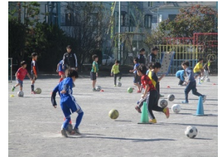
こどもサッカースクールの開催

・東京 2020 オリンピック・パラリンピックへの機運醸成として、大会グッズの巡回展示や競技体験会等を実施します。