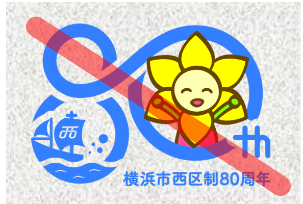
※単一色以外の背景