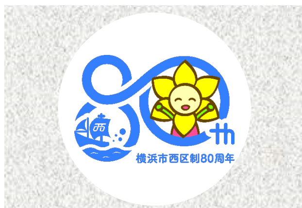
※円形で確保する場合