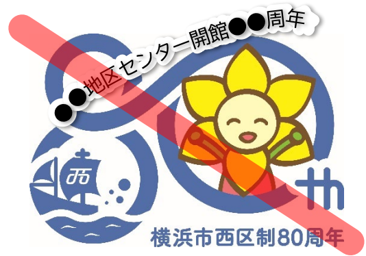
※図形・文字の重ね