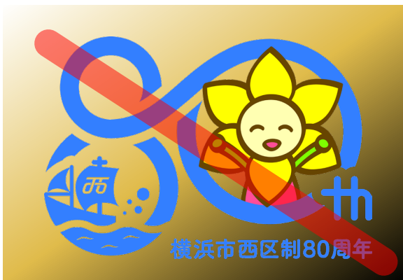
※単一色以外の背景

6 ロゴマークの背景色は原則白色とすること。白色以外の単一色を用いたい場合は、個別に相談すること。単一色以外の背景は用いないこと。