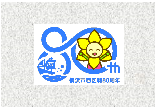
※方形で確保する場合

7 単一色以外の背景を用いる場合は、使用するロゴマークの保護領域(白色)を確保すること。