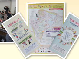
かさま つながるマップ