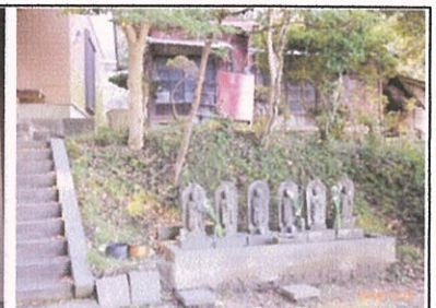
④臺瀧山長谷寺 臨済宗建長寺派

(1512)頃に玉縄城の出城として整備された。現在でも空壕、塚などが残されている。