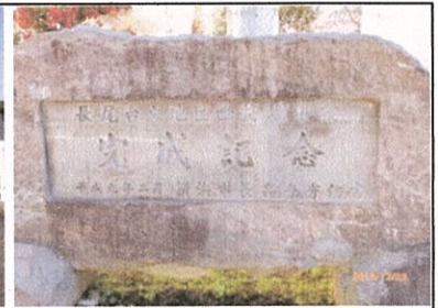
⑥長尾台土地区画整理事業完成記念碑

【出所】 栄区歴史散策マップ（歴史探検帳） 戸塚くるぶ 戸塚の散歩みち 関係HP