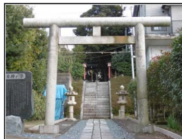
⑪子ノ神・日枝神社