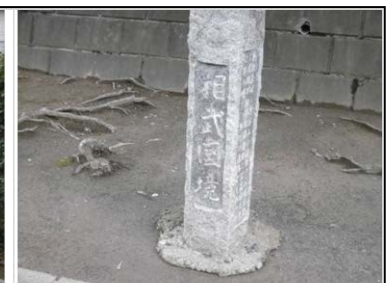
⑫相武の國境の道標