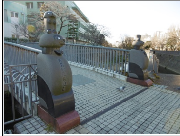
①大いたち橋・小いたち橋

①大いたち橋・小いたち橋 栄区役所近くの橋の入口と出口の柱にいたちの頭がデザインされている。橋の地面にもいくつかのいたちの足跡がデザインされている。円形の休憩ゾーンは憩いの場としていつも大勢の人が訪れる。