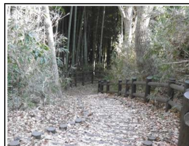
⑨本郷ふじやま公園