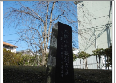
④本郷小学校創設地記念碑