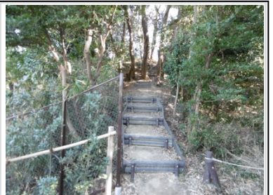
⑥鍛冶ヶ谷市民の森