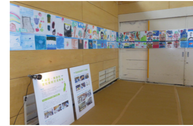
●コーナーに一列につなげました