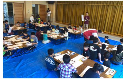
●南部町のいいところを紹介します