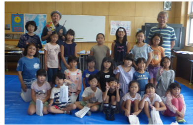
●参加者全員で記念撮影です