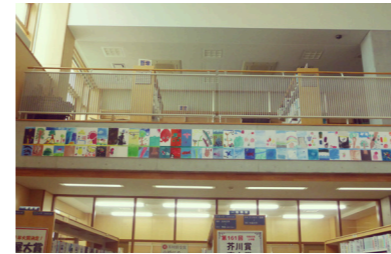
●図書室の中に入って正面2階の梁に展示