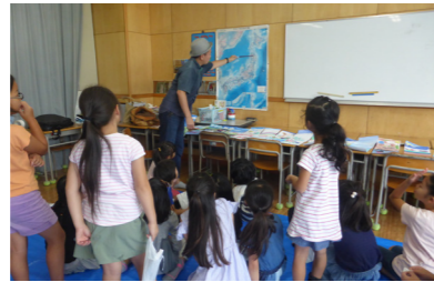
●南部町の位置を日本地図で確かめました