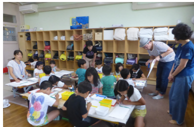
●栄区のいいところを教えよう