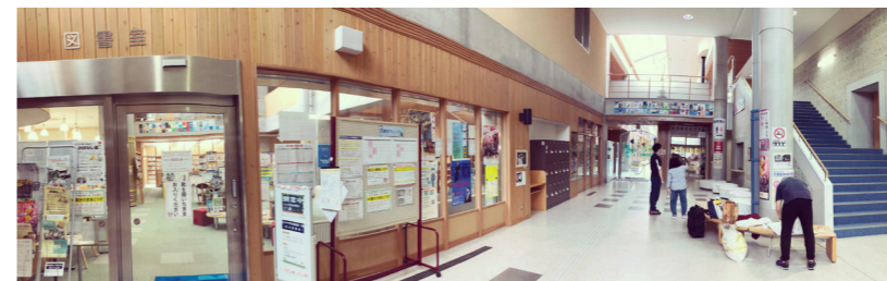
●南部町立町民ホール「楽楽（らら）ホール」のロビーで一望できます。