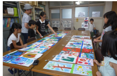
●たくさんのいいところが並びました