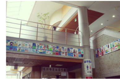
●ロビー正面の2階の梁と右側の壁に展示