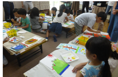
●栄区にはいち川があるんだよ