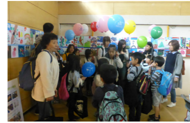
●栄区民まつりで本郷中学校体育館の壁に展示