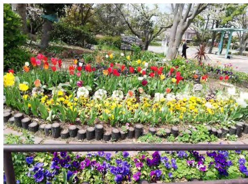
四季折々の花を咲かせている荒井沢公園の花壇

横浜市のホームページの「公園愛護会の皆さんへ」を検索してください。 球根ミックス花壇の作り方の動画が見られます！