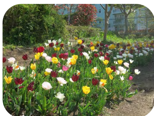
平工先生と公園愛護会さんが一緒に作った本郷公園の「球根ミックス花壇」