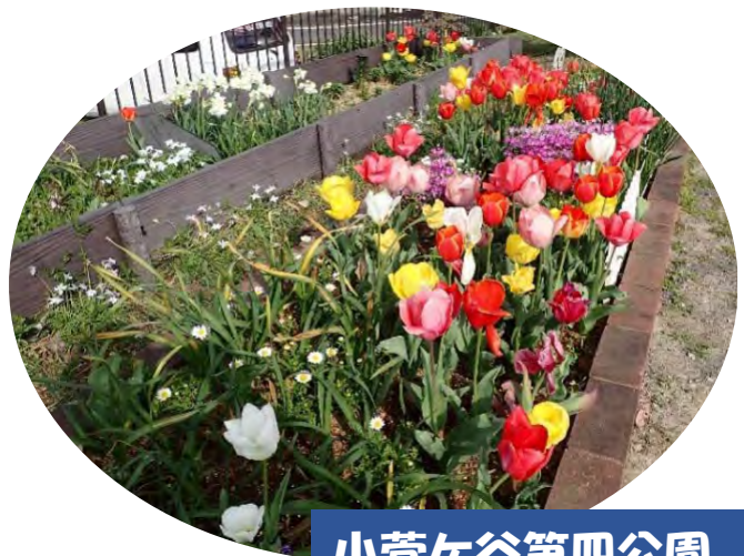
小菅ヶ谷第四公園