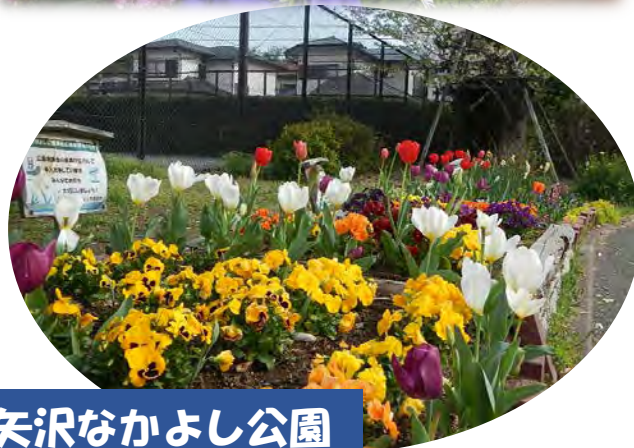
矢沢なかよし公園