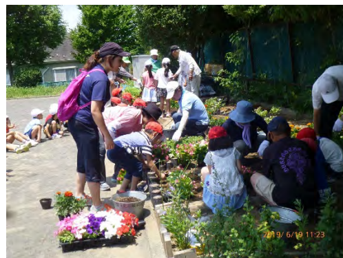
小菅ヶ谷小学校生と本郷台三丁目公園愛護会