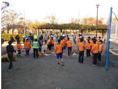
桂台中学校生と桂山公園愛護会の清掃活動

これらの公園愛護会以外でも子ども会や小学校・中学校の児童と一緒に清掃活動や花壇づくりを実施している公園愛護会があります。