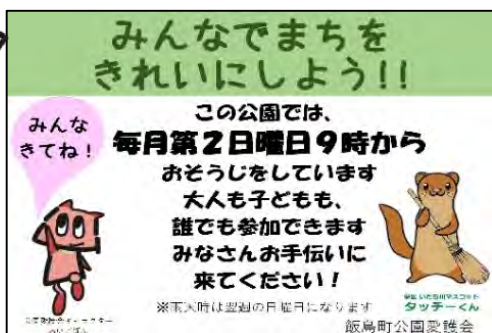
飯島町の4公園(飯島町久保、飯島長谷、飯島すずみどう、小殿谷橋)に貼った活動PR看板