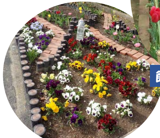
本郷台三丁目公園