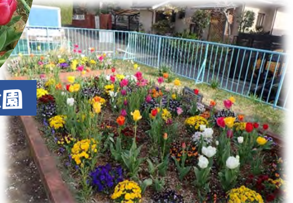
小山台一丁目公園