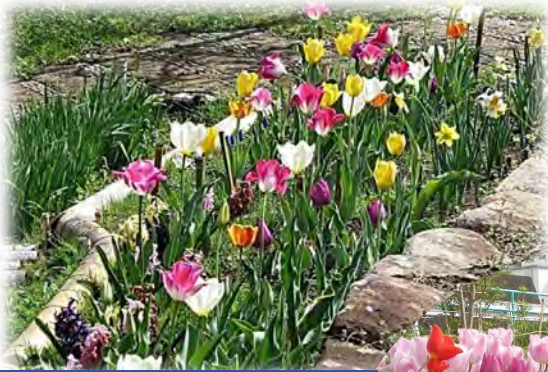
本郷ふじやま公園

前号でお知らせしました栄区の球根ミックス花壇を紹介します。公園でこんな花壇を作りたい！とお思いの公園愛護会さんには、環境創造局公園緑地維持課や栄土木事務所がお手伝いします。秋に色々な球根をミックスして植えることで春に美しい花壇が楽しめます。ぜひ公園やご自宅の庭でチャレンジしてみてください。