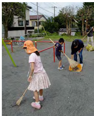
子ども会とたいら台公園愛護会