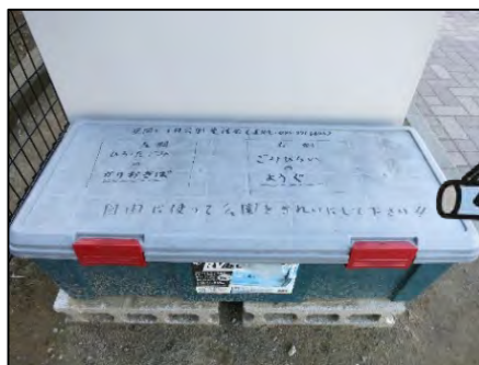
笠間三丁目公園で遊びに来た人がごみ拾いをしていったごみ袋を保管しておく道具箱