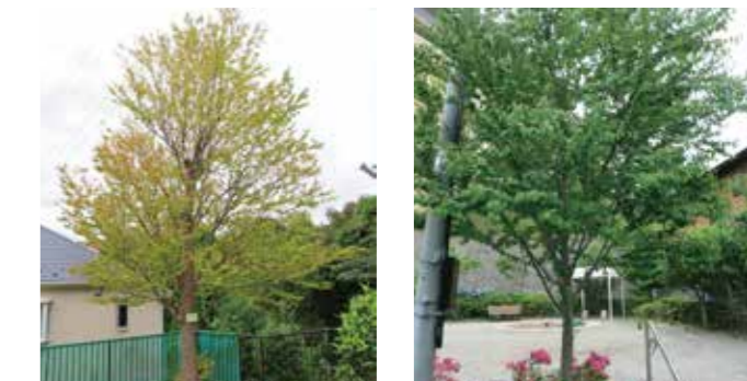
本郷台三丁目公園