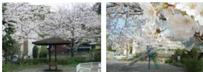
長尾台けやき公園