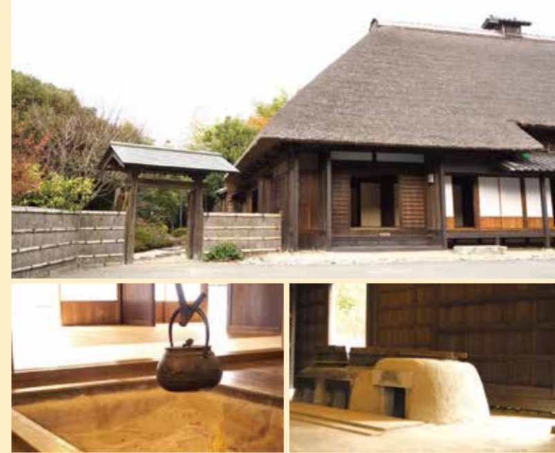
本郷ふじやま公園 栄区鍛冶ヶ谷1-20

本郷ふじやま公園は、江戸時代後期の名主屋敷(通称:古民家)があることで知られている公園です。古民家では1年を通して四季折々の行事や、体験教室等の講座を開催しています。また、古民家の中には囲炉裏、かまどなどの昔懐かしい道具がたくさん置かれています。そばに座ってみると、懐かしさと暖かさを感じられるかもしれません。元大橋口から古民家へ向かう園路では梅林を楽しむことができ、2月が見頃となっています。富士山のビューポイントでもあり、夕日と富士山のコラボレーションを撮影することもできます。