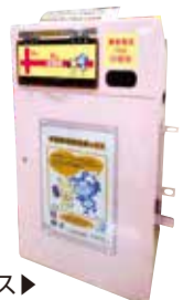
小型家電回収ボックス▶