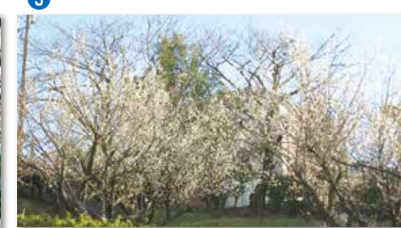
⑤2月と言えば梅が見頃です。飯島南公園、本郷ふじやま公園などで梅林を楽しめます。(写真は飯島南公園)