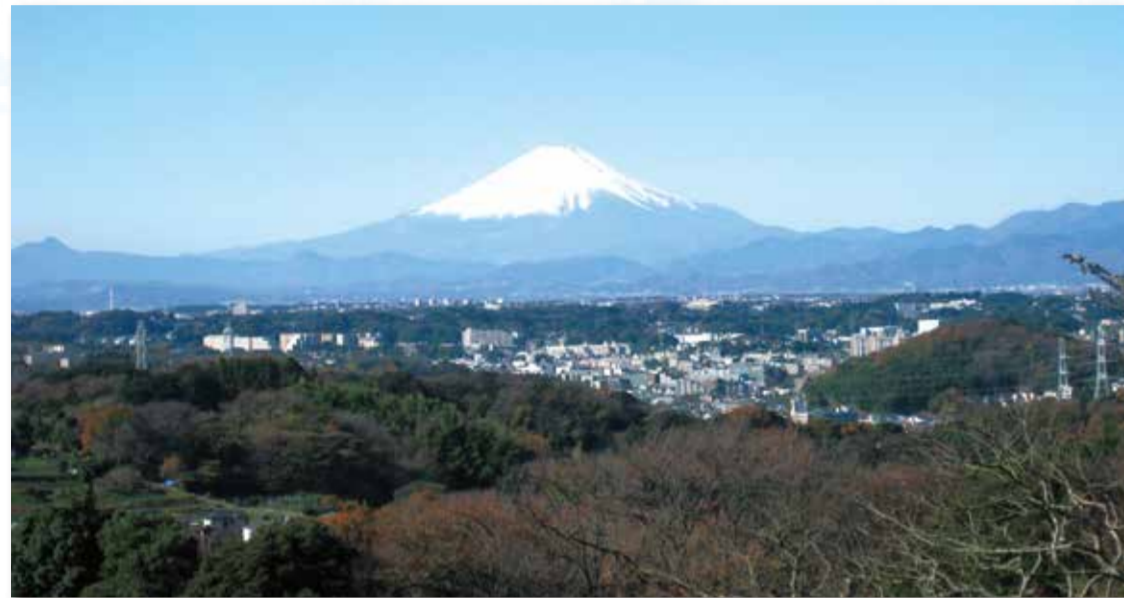
①尾根道から見える大寒の富士 撮影場所: 瀬上市民の森

冬は空気が澄んでいて、富士山の撮影にぴったりの季節。栄区には富士山を見ることのできる場所がたくさんあります。あなたの知っているあの場所も、実は富士山で有名な場所かもしれません。