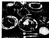
クリスマス料理講座