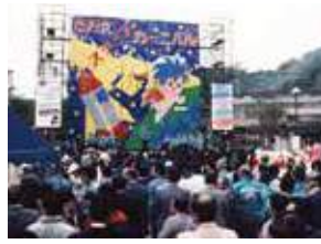
さかえステップカーニバル