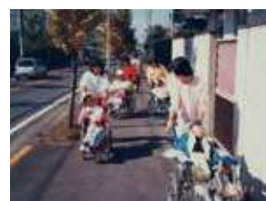
知的障害者通所更生施設「朋」