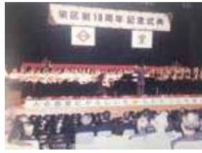
栄区制10周年記念式典