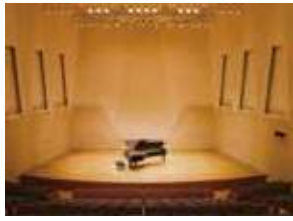
栄区民文化センター「リリス」