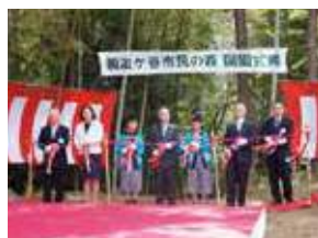
鍛冶ヶ谷市民の森