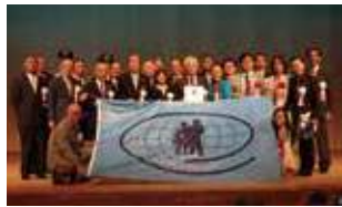
セーフコミュニティ認証式典