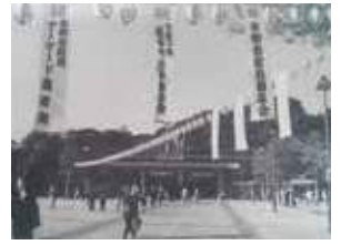
本郷台駅前（1986年当時）