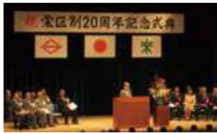
栄区制20周年記念式典