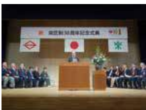
栄区制30周年記念式典