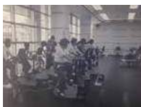
栄公会堂・栄スポーツセンター

「中野地域ケアプラザ」及び「SEELP杜」の開設（4月）。「荒井沢市民の森」開園（5月）。