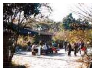
横浜自然観察の森