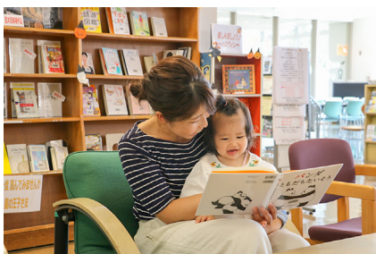
中屋敷地区センター 図書コーナー