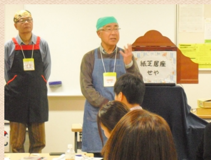
紙芝居読み聞かせボランティア