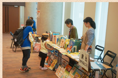
イベント会場での本の貸出