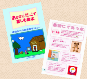
月齢に応じた本の紹介