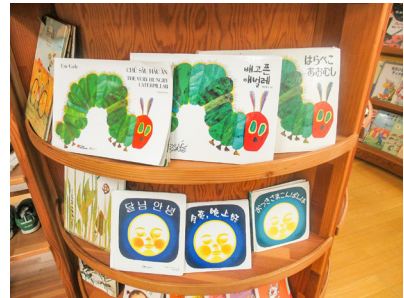
「にこてらす」外国語の絵本コーナー