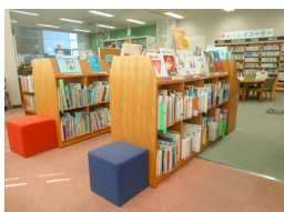
児童書とティーンズコーナー