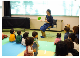
子どもの読書活動の推進