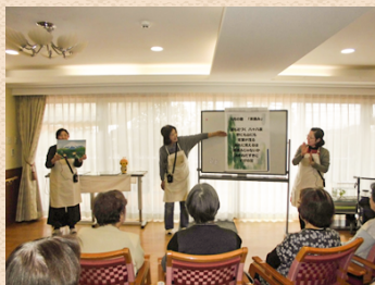
高齢者施設での読み聞かせ