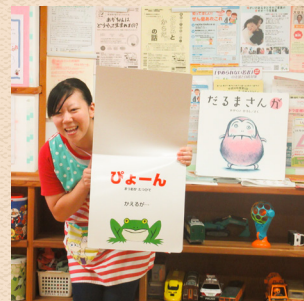
読み聞かせの実施