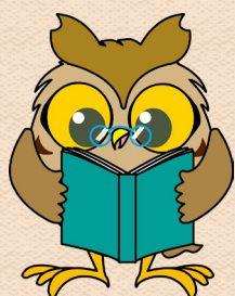
瀬谷区マスコット せやまる