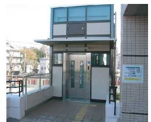
三ツ境ライフ西側デッキエレベーター

「みんなにとってやさしいまち」をつかっていくため、上記のサイン設置を行う各事業者のほか、警察、地元商店街が協力してバリアフリー化事業を進めていきます。