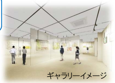
ギャラリーイメージ

【発行】横浜市瀬谷区区政推進課 〒246-0021 横浜市瀬谷区二ツ橋町190 TEL:045-367-5631 FAX:045-365-1170 E-mail se-kusei@city.yokohama.jp