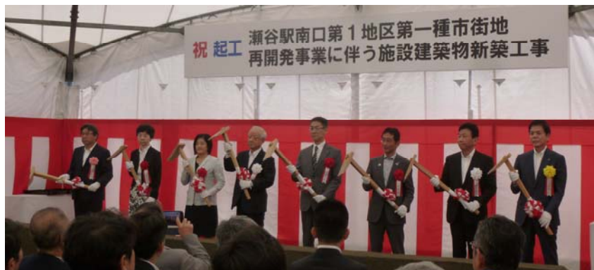
起工式(令和元年7月26日)

現在、建築工事は順調に進み、建物を支える杭工事や山留工事が完了し、地下躯体工事が行われています。令和2年度は、躯体工事と区民文化センターの設備・内装工事が行われる予定です。