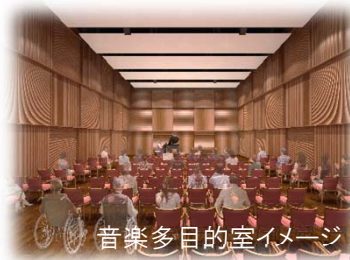
音楽多目的室イメージ