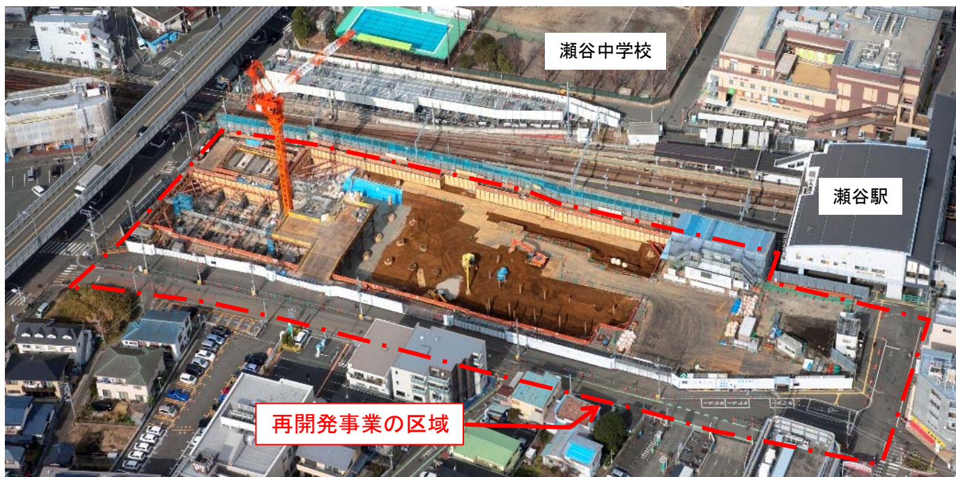
航空写真(令和2年1月)