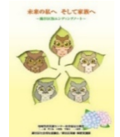
エンディングノート