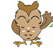
瀬谷区マスコットせやまる