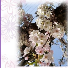
海軍道路の桜

東さんのオープンガーデン(4月5日～7日、5月10日～12日)に行ってみませんか。