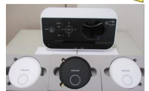
超短焦点 プロジェクター