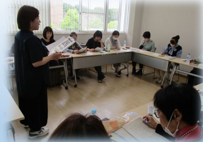
「初心者向け韓国語入門講座」の様子

初級と中級の2つのグループとして活動を開始しています。韓国語に興味がある方は、区民活動センターまで、お問い合わせください。