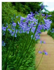
和泉川のアガパンサス

育ちは東京の雑司ヶ谷という鈴木さん。結婚して瀬谷に移り住んで45年余り。子育てしていく中で地域に知人も増え、学校の役員や、地域の活動に参加するようになりました。2008年に区役所主催の「民話アートスクール」に参加して初めて影絵に触れ、「影絵グループ花いちもんめ」として活動を始めました。人前に出るのには恥ずかしい方だったけれど、今までやってこなかったことをやってみようと思い、子育てや介護をしながら続けて来ました。メンバーが減って大変な時もありましたが、16年間も続けて来られたのは、いつも手助けしてくれる人達がいたことと、影絵の楽しさに魅了されたから。色鮮やかで美しい映像をその場で表現し、子どもから大人まで楽しめる影絵は、同じ演目をやっても毎回違うところが魅力です。一緒に活動したい方募集中です!