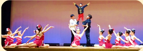
瀬谷新体操サークルさん