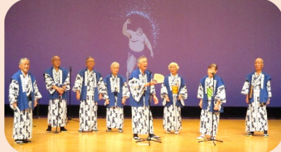
瀬谷相撲甚句会さん