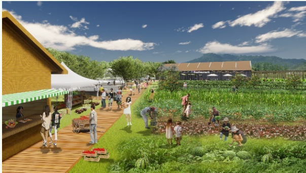
▲「次世代の暮らしの体験」イメージ

国際園芸博覧会は、「国際的な園芸文化の普及や花と緑のあふれる暮らし、地域・経済の創造や社会的な課題解決への貢献」を目的に開催されています。