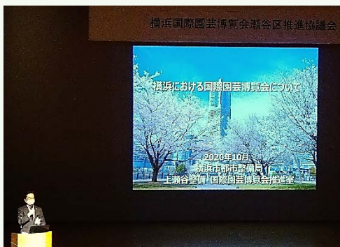
▲都市整備局による博覧会の説明