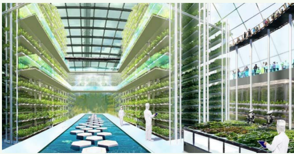
▲「最先端の環境技術の体感」イメージ