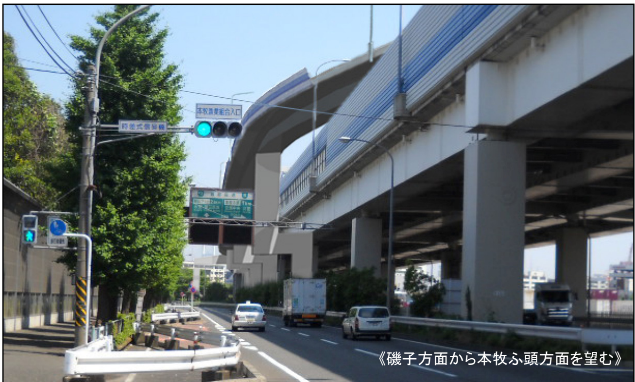
【完成予想図(フォトモンタージュ)】