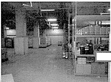
機能的格納スペース（迅速な出動が可能）