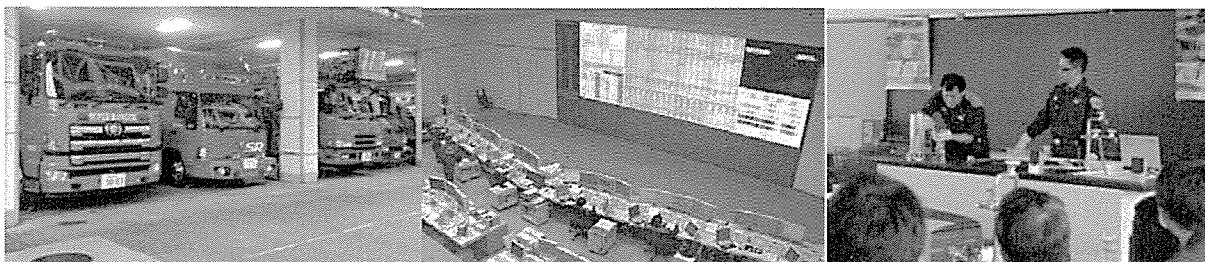
消防本部視察 (SR、司令センター)

「SR」や「司令センター」等の視察をはじめ、火災原因の鑑定を行う「消防科学研究室」を一部公開することにより、市民の皆様身近に「消防」に触れてもらうことで、火災予防等に関する啓発を行うとともに、「生活の安心感」を実感できる機能を持たせます。