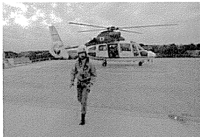
ヘリポート（緊急離発着場）

機動的な救助活動等ができるヘリコプターの「緊急離発着場」をはじめ、本部直轄の特別高度救助部隊（通称「SR」）や緊急消防援助隊が災害の状況に適應した資機材を素早く選択・搭載できる「機能的格納スペース」を整備し、災害対応能力を向上させます。