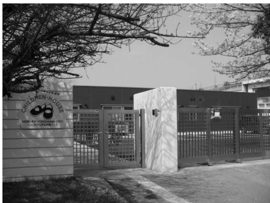
港北水再生センター（港北区大倉山）

環境創造局と連携し、下水道事業用地2か所で10年間限定認可保育所を開所しました。