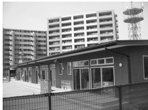
北部第一水再生センター（鶴見区元宮）