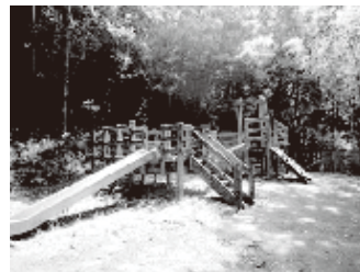
冒険広場(アスレチック)