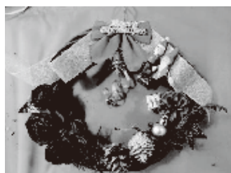
クリスマスリース・ツリーづくり