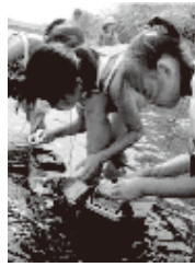
干潟の生き物観察