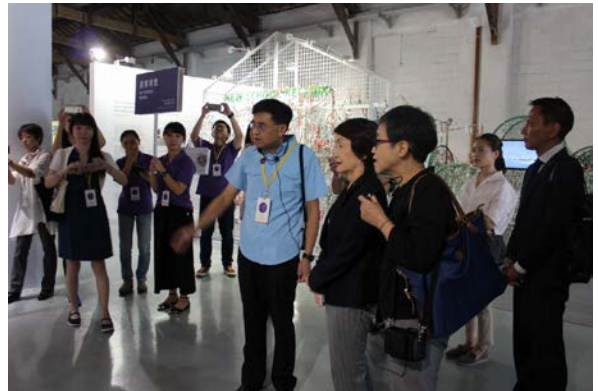
世界デザイン首都 台北 2016 の事務局を務める台湾デザインセンター・センター長代理の案内で視察

横浜市が進める、市内中小企業の技術力とクリエイターのアイデアをかけあわせて新商品を開発・販路開拓を目指すプロジェクト、「 taxi yokohama 」の成果を、「 世界デザイン首都 台北 2016 」に出展し、世界のデザイン関係者に向けて発信しました。