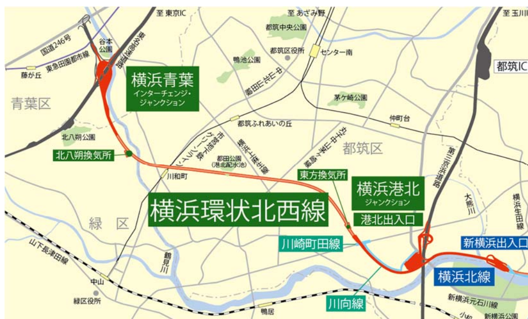
▼図 1 北西線位置図