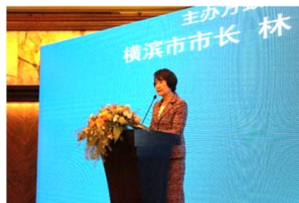
11月20日 経済セミナー開催