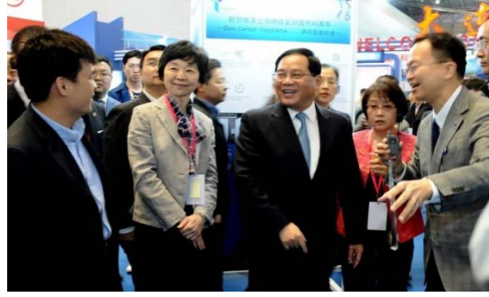
4月19～21日 第6回中国（上海）国際技術輸出入交易会