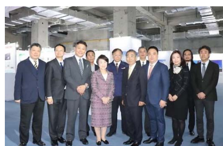
11月21日 虹橋輸入展示交易中心 横浜企業ブース訪問