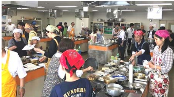
5月26日 おさかな日中家庭料理交流