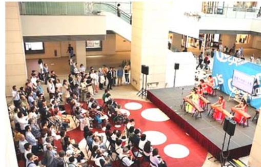
10月8日 45周年記念イベント