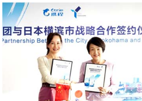
11月19日 Ctrip との連携協定締結