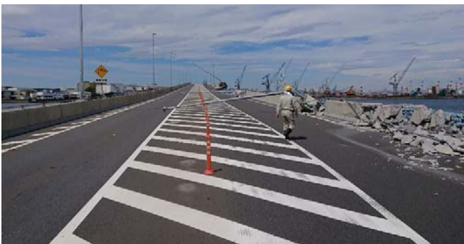
【はま道路橋梁の表面①】