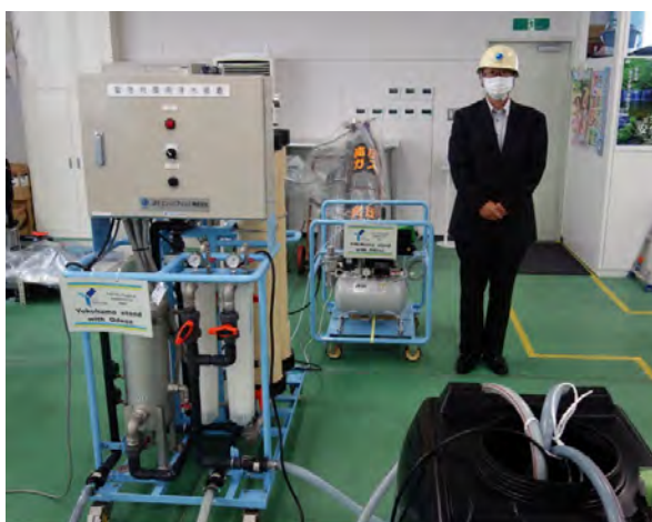
(1) 「非常用浄水装置 II型」