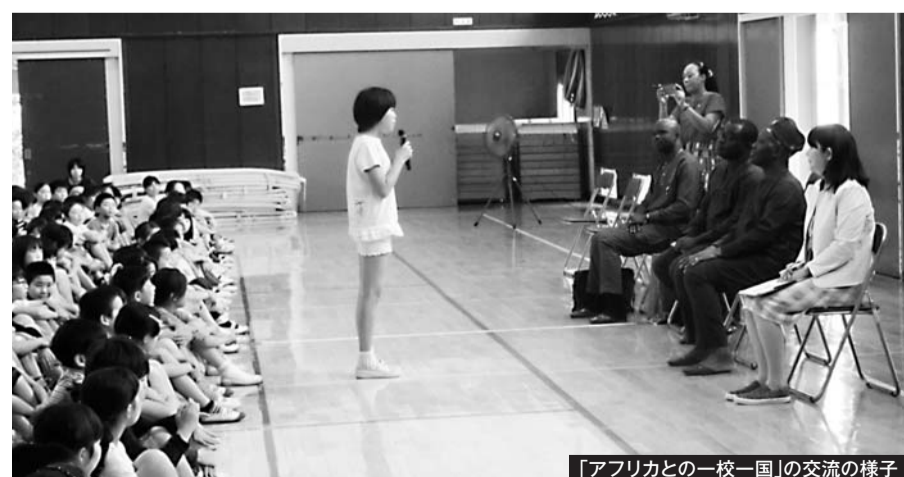
「アフリカとの一校一国」の交流の様子

アフリカとの一校一国 (文中の _____ (※1)で表示) 市内小中学校がアフリカの一国を交流国と定めて交流を行うことにより、アフリカ各国への理解を深めることを目的とした取組。