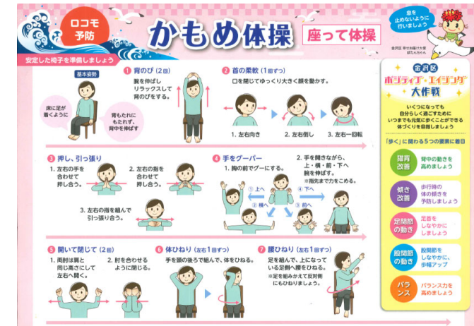
「かもめ体操」リーフレット