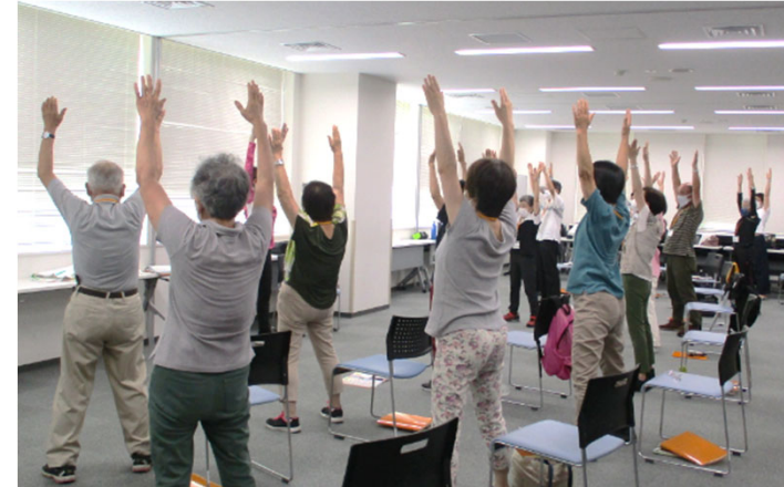
金沢区元気づくりマイスター養成講座