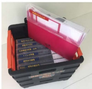
避難所開設キットイメージ