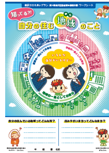
福祉教育ワークシート

○ワークシートを活用して今年度授業を行った中学校の事例を参考に、区内全中学校での福祉教育の実施に向け、授業の進め方のノウハウの共有などのサポートを積極的に推進