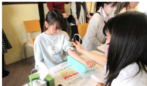
横浜市立大学「看護生命科学ゼミ」 イベントでの皮膚測定