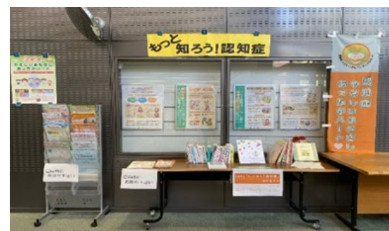
図書館での認知症啓発パネル展