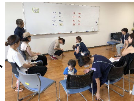
区民向け3回講座の様子