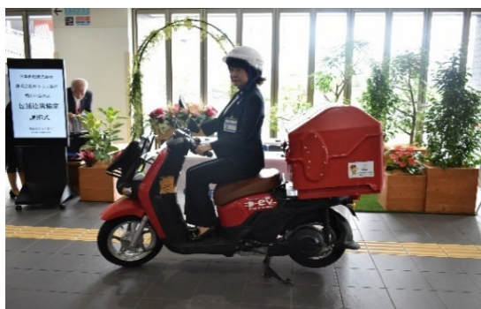
日本郵便株式会社・株式会社ゆうちょ銀行との連携(配達車に園芸博ステッカーを貼ってPR)