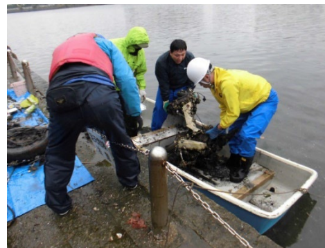
平潟湾クリーンアップキャンペーン