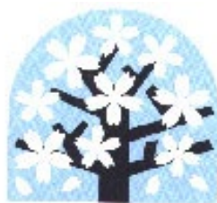
区の木「ヤマザクラ」