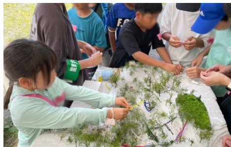
関東学院大学「中津研究室」 「アスレの森」ワークショップ