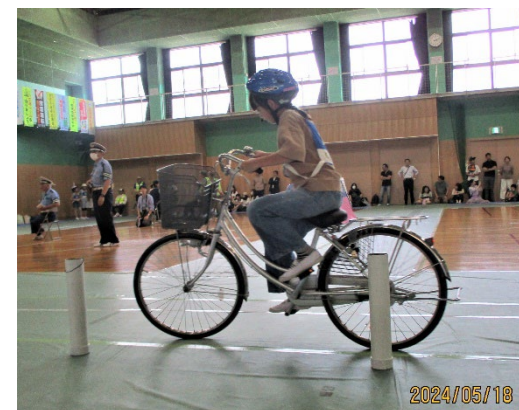
自転車マナーアップ小学生大会