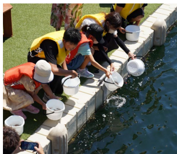
海の生き物教室「稚魚放流」