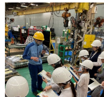
鉄道車両工場見学