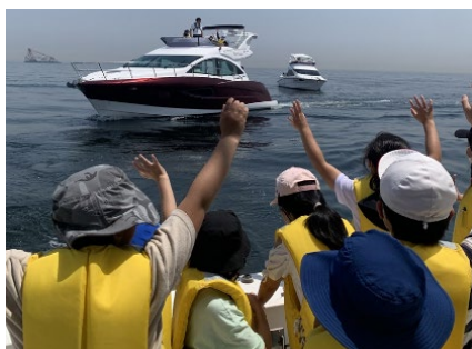
クルーザーの乗船体験