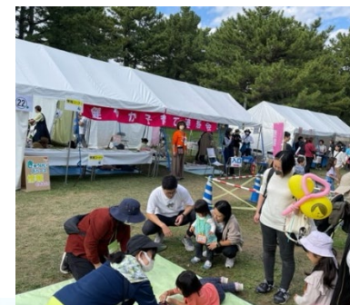
いきいきフェスタの様子