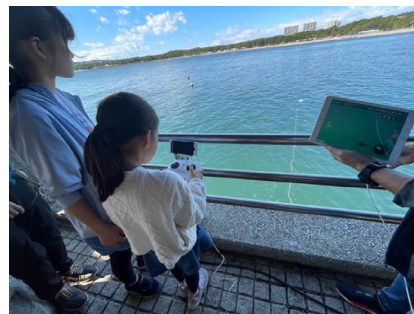
海中探検(水中ドローン)