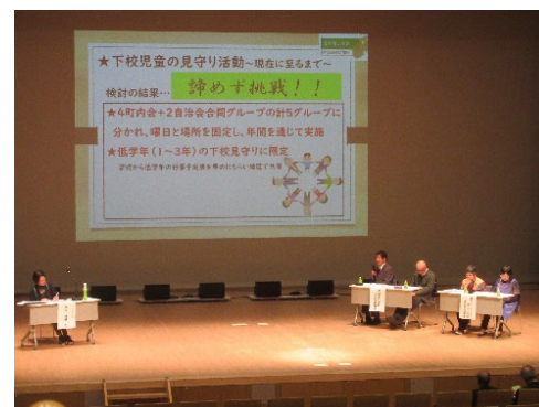
福祉保健のつどい