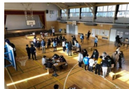
良品計画と連携した防災教室