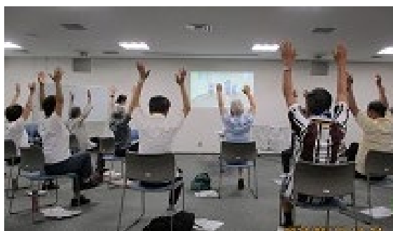
元気づくりマイスター養成講座