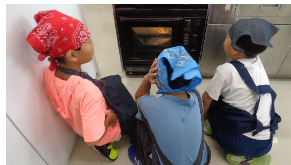
横浜市立大学「三輪研究室」 みんなでまち保育プロジェクト 社会科見学&楽しいピザづくり