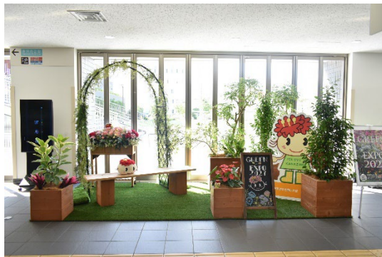
園芸博PRフォトスポットの設置 (金沢区役所1階)