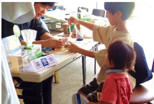
関東学院大学「LINKAI 横浜金沢ラボ教職研究室」 金沢区における子どもを 対象とした科学教育活動