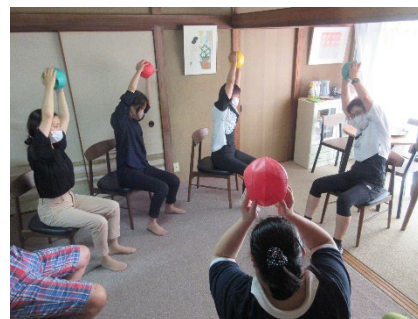
釜利谷ふれあいカフェ 「健康リンパ体操」