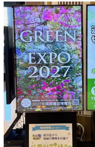
デジタルサイネージによるPR (イオン金沢八景店)