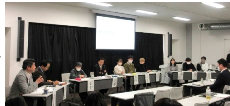
地域づくり 金沢フォーラム