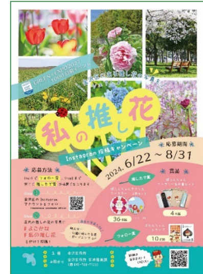
Instagram「#私の推し花」 投稿キャンペーン