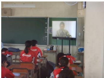
中学生向けの防災教育