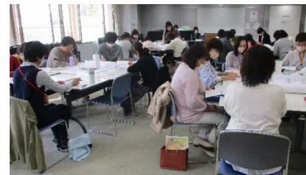
地区別交流会の様子