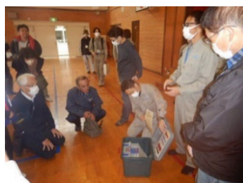
地域防災拠点開設キット試行訓練