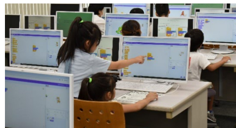
子どもプログラミング教室