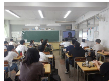
中学校への防災教育(西柴中)