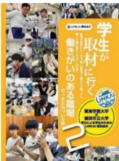
PR冊子「学生が取材に行く」 企業取材の様子