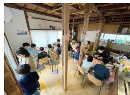
こずみのANNEX 「算数ワークショップ」