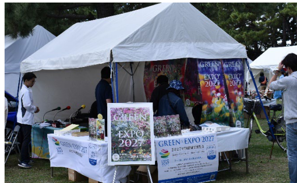
区民まつり・いきいきフェスタ 園芸博PRブース出展