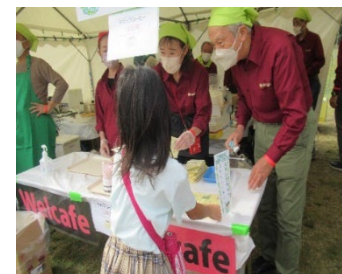
いきいきフェスタPRブース