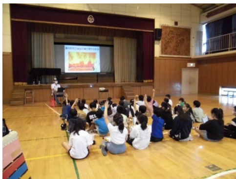
小学校における出前教室

○歩行喫煙・ポイ捨て禁止キャンペーンの実施【5月24日、10月26日、金沢文庫駅西口】や、平潟湾クリーンアップキャンペーンの実施【11月12日・参加者213人】など。