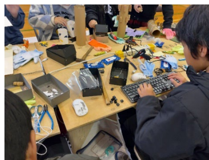
スクールファクトリー