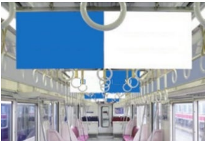
電車の中張り広告イメージ ※車内全面ではなく一部に掲示

京急電鉄株式会社をはじめとした、かなざわ八携協定の各企業・団体と連携して、電車の中張り広告や金沢区でのくらしをイメージできるリーフレットの駅配架等を実施予定