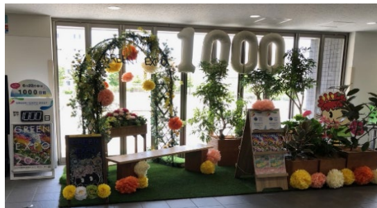
開催1000日前記念装飾 (金沢区役所1階)