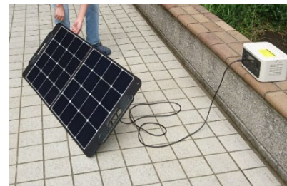
えんづくり補助金(ソーラーパネル発電機)