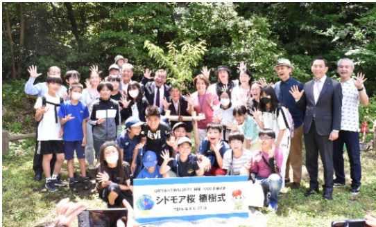
開催1000日前記念 シドモア桜植樹式(能見堂緑地)