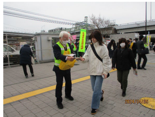
駅頭キャンペーン