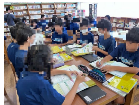
中学生向けワークシートの活用風景