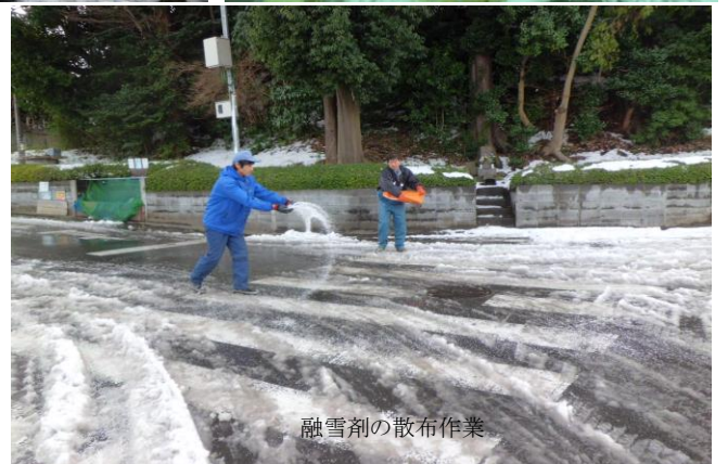
融雪剤の散布作業