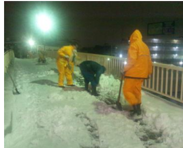
↑ 8日深夜の除雪作業 →