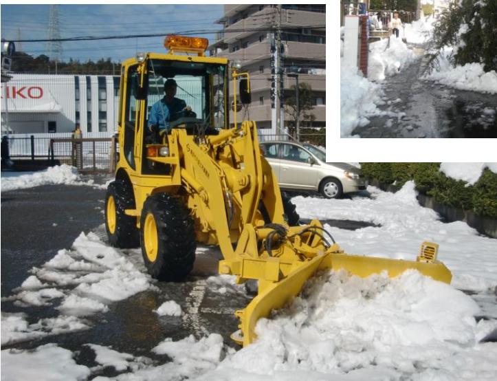
↑ 除雪に大活躍したペイローダー