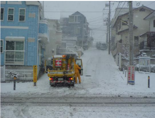
↑ チェーン規制の看板の設置

また、横浜建設業協会戸塚区会会員企業の皆さんには、環状4号線や、戸塚駅及び東戸塚駅周辺の除雪を実施してもらうなど、連携して区民生活の安全確保に取り組みました。今回の大雪に対する土木事務所の主な活動を次のとおりご紹介します。