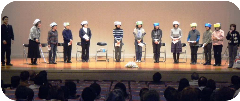
寸劇「800のキャップも1こから」