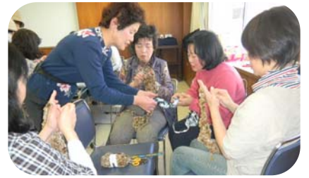
よこはま消費生活講師の会による講習会も好評でした。