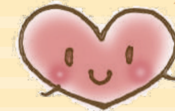
とつかハートプラン マスコット「ころん」

とつかハートプランはこのまちのような「誰もが安心して心豊かに暮らすことのできるまち」を目指しているんだよ