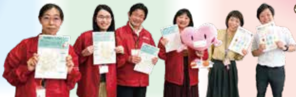
区社会福祉協議会職員